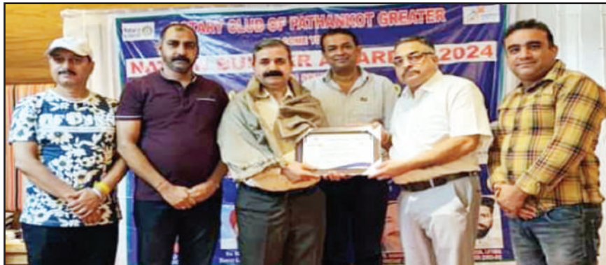
ਉਨ੍ਹਾਂ ਨੇ ਸਟੇਟ ਅਤੇ ਰਾਸ਼ਟਰੀ ਪੱਧਰ ਤੱਕ ਭਾਗ ਦਵਾਇਆ।