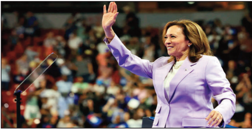
ਵਕੀਲ ਵਜੋਂ ਆਪਣੇ ਸ਼ੁਰੂਆਤੀ ਕਰੀਅਰ ਦੌਰਾਨ ਮੈਂ ਸਿੱਖਿਆ ਦੇ ਅੰਦਰ ਹੀ ਜਾਂ ਬਾਹਰ ਹੀ, ਉਪਰ ਅਸਰ ਪੈਂਦਾ ਹੈ। ਹੈਰਿਸ ਨੇ ਕਿਹਾ ਕਿ ਜਦੋਂ ਤੁਹਾਡੇ ਸਾਹਮਣੇ ਮਾਈਕਰੋਫੋਨ ਹੋਵੇ ਤਾਂ ਹੈਰਿਸ ਨੇ ਕਿਹਾ ਕਿ ਜਦੋਂ ਤੁਹਾਡੇ ਵੱਲੋਂ ਵਰਤੋਂ ਗਏ ਸ਼ਬਦਾਂ ਦਾ ਚਾਹੇ ਕੋਈ ਜੇਲ ਨੇ ਕਿਹਾ ਕਿ ਜਦੋਂ ਤੁਹਾਡੇ ਸਾਹਮਣੇ ਮਾਈਕਰੋਫੋਨ ਹੋਵੇ ਤਾਂ